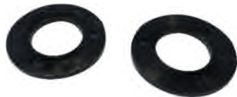
ABSTANDHALTER (für Abzüge im Format 10 x 15)